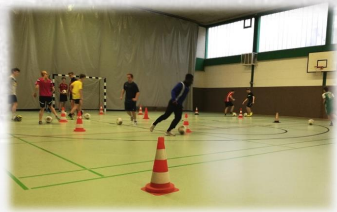
Junior Coach program Jan 17